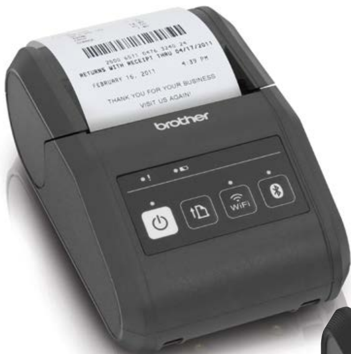
Impression de reçus RJ-3050/RJ-3050Ai

Imprimante d'étiquettes et de reçus portative de 3 po