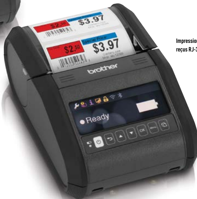
Impression d'étiquettes et de reçus RJ-3150/RJ-3150Ai